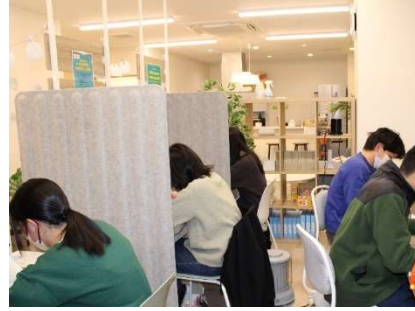
▲子供たちの勉強風景（参考写真）