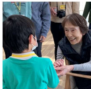
▲高齢者と子供たちの交流風景（参考写真）