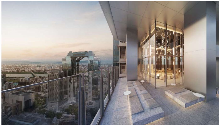
フルハイトサッシを全面窓に使用した高層階の共用部 イメージ