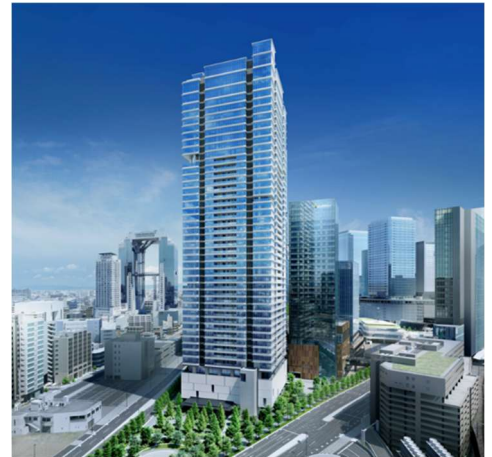
自然と都市機能が調和するグラングリーン大阪の「南街区」に立地 イメージ