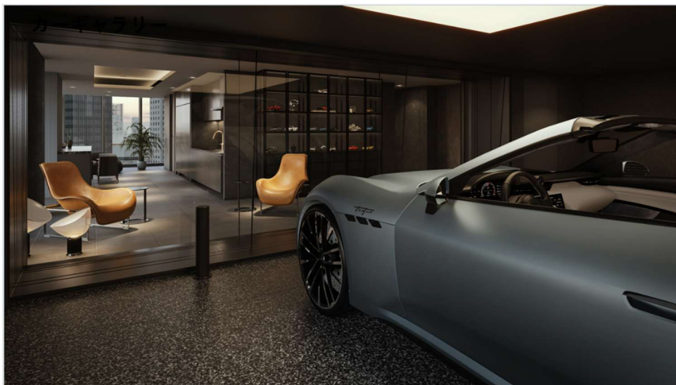
カーギャラリー付き住戸 イメージ