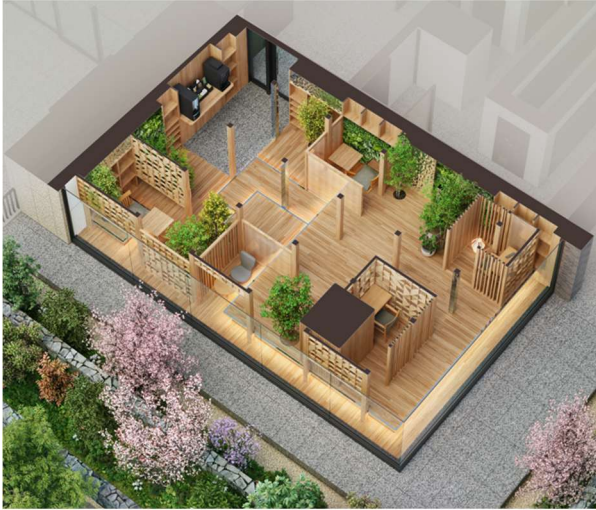
▲ラウンジ完成予想 CG