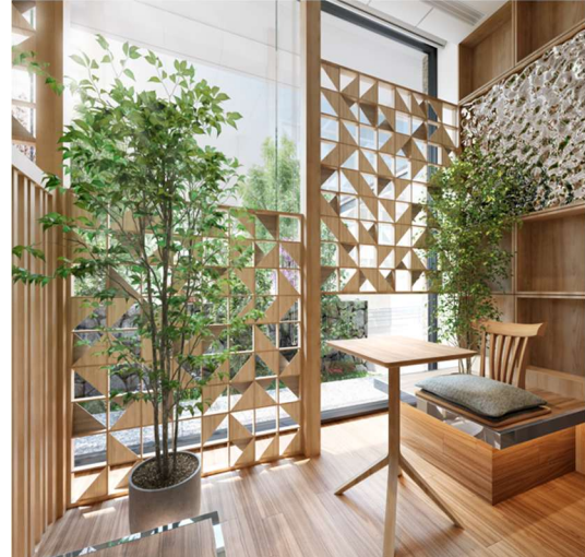
▲ラウンジ完成予想 CG