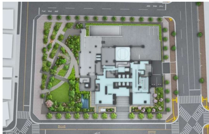
▲敷地配置イメージイラスト

周辺には学校や教育施設、医療機関、商業施設が点在し、都心近接でありながら落ち着いた暮らしを支える生活環境が整っています。