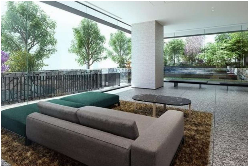
▲ガーデンラウンジ完成予想 CG

都市居住の快適性を高めるとともに、暮らしにさらなる豊かさと上質な時間をもたらします。